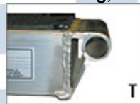
Huvud med tub Även M030, M040