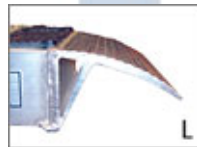
Standard (utom M050)