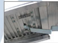
M140 – M150