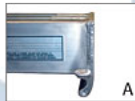
Huvud med stödkrok