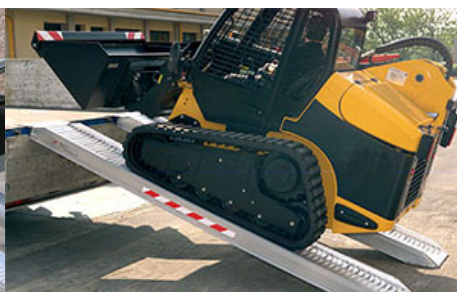
Modell M070 – M115A, M125 – M230