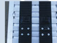
M070 – M230