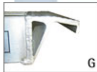
Huvud med krok