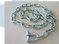
M120S – M230