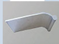
M030 – M125 (utom M050, M120S)